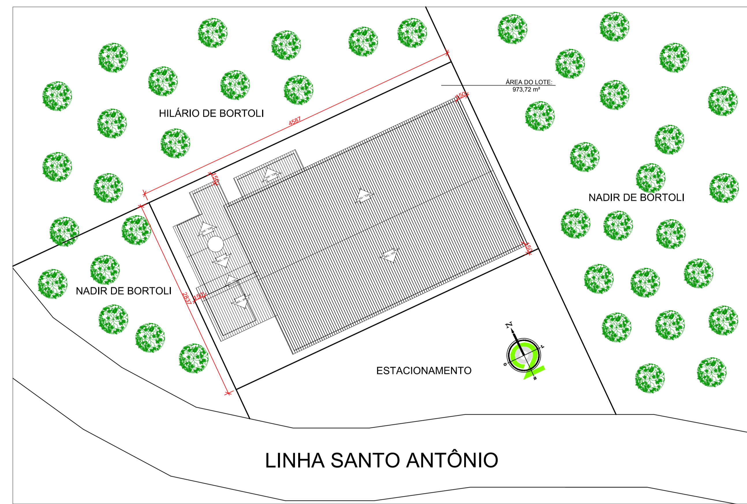
COBERTURA / SITUAÇÃO E LOCALIZAÇÃO ESC ___ 1:300