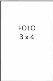
FOTO 3 x 4

Telefone Celular: _____ - _____ Telefone /residencial: _____ - _____