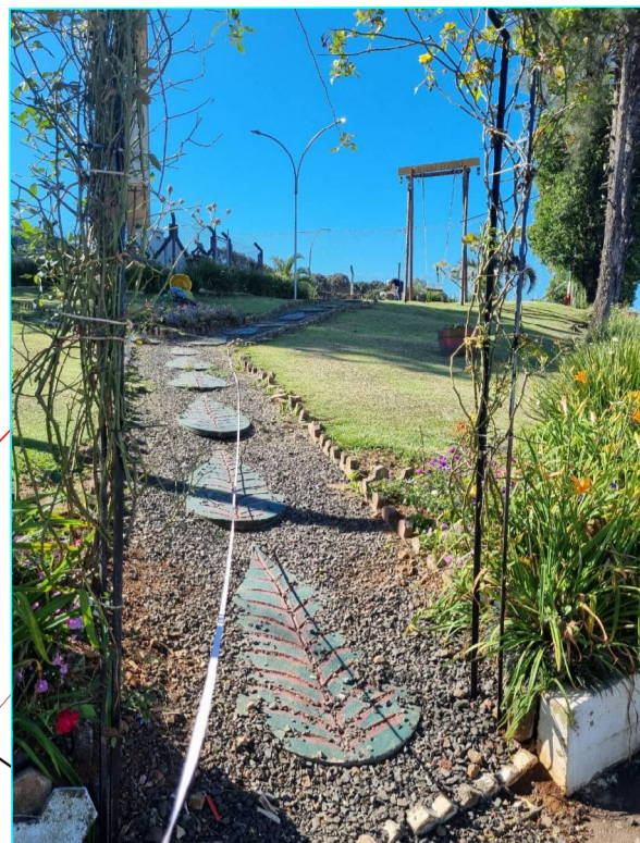
ACESSO SECUNDÁRIO L=5,00m