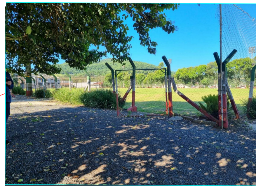
ACESSO PRINCIPAL L=9,00m