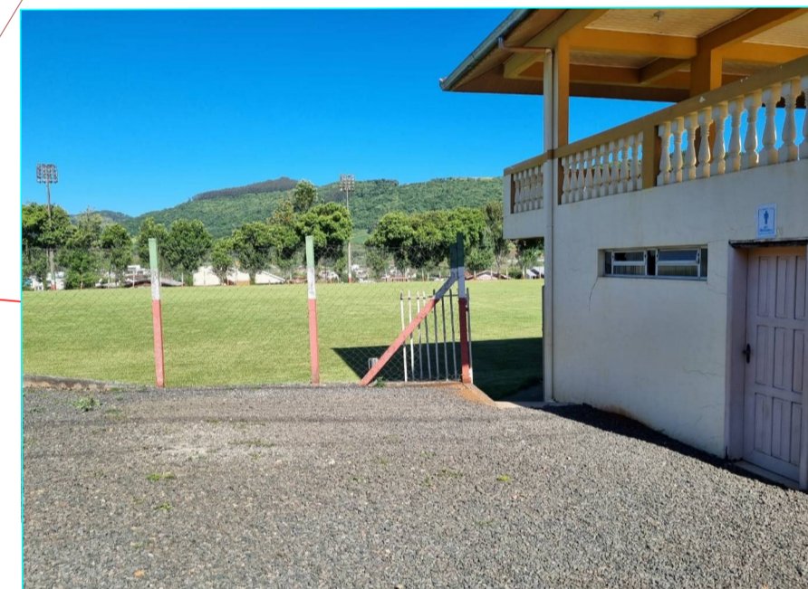
ACESSO MENORES L=1,20m