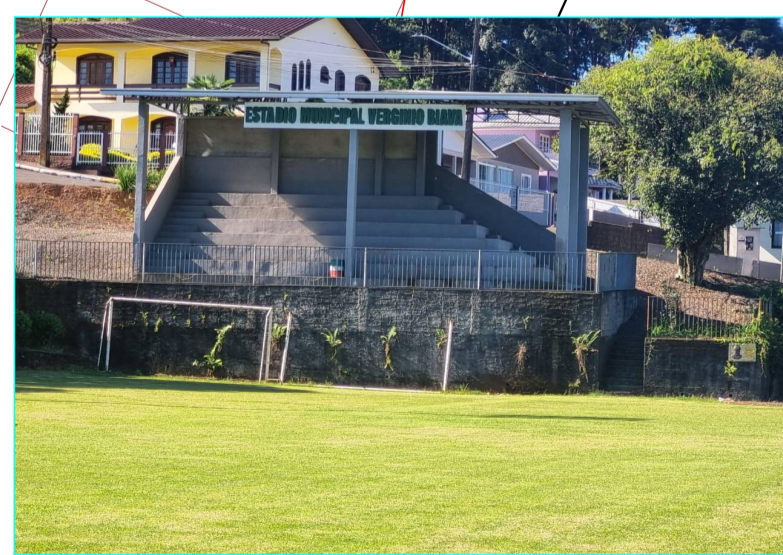
ACESSO RESTRITO L=1,20m